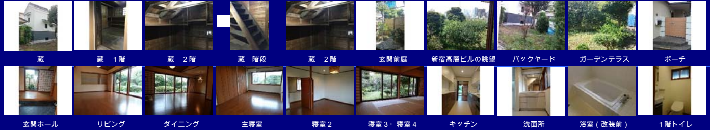
蔵 蔵 1階 蔵 2階 蔵 階段 蔵 2階 玄関前庭 新築高層ビルの眺望 バックヤード ガーデンテラス ポーチ 玄関ホール リビング ダイニング 主寝室 寝室2 寝室3・寝室4 キッチン 洗面所 浴室(改装前) 1階トイレ

神田川至近閑静な住宅地の敷地面積約700㎡(212坪)内に建つ希少物件。 駅至近というだけではない魅力の希少立地 - JR総武中央線・都営大江戸線 東中野駅 徒歩6分 | 東西線 落合駅 徒歩5分 ■ TPOに於いて選べる徒歩圏内の充実した買い物施設の存在(ユニゾンモール、ライフ、マルエツプチ他)、サンモール中野まで2.7km(自転車11分) ■ 山手通り 約600m、早稲田通り 約500mと利便性あふれる立地ながら閑静な私道に面した敷地内住宅。 ■ Lycee Francais internation de Tokyo (東京フランス国際学園)スクールバス バス停まで2.4km 都心では希少な広いアウトドアスペース付きの戸建 - リビングからの広いテラスガーデン、ドッグラン利用可能なバックヤード ■ 家電製品各種新規設置済み(洗濯機・乾燥機・ミール食器洗い乾燥機・冷蔵庫)設置 ■ 各部屋個別空調・リビング・ダイニングへは床暖房新規設置(2017年7月)。 ■ Kitchen House社製ビルトインオープン付高級システムキッチン・浴室・一体型シャワートイレ入替・全室フローリング・クロス交換・リビングダイニング床暖房新規設置(2017年7月) 快適な生活をサポートする ホスピタリティ重視の管理体制